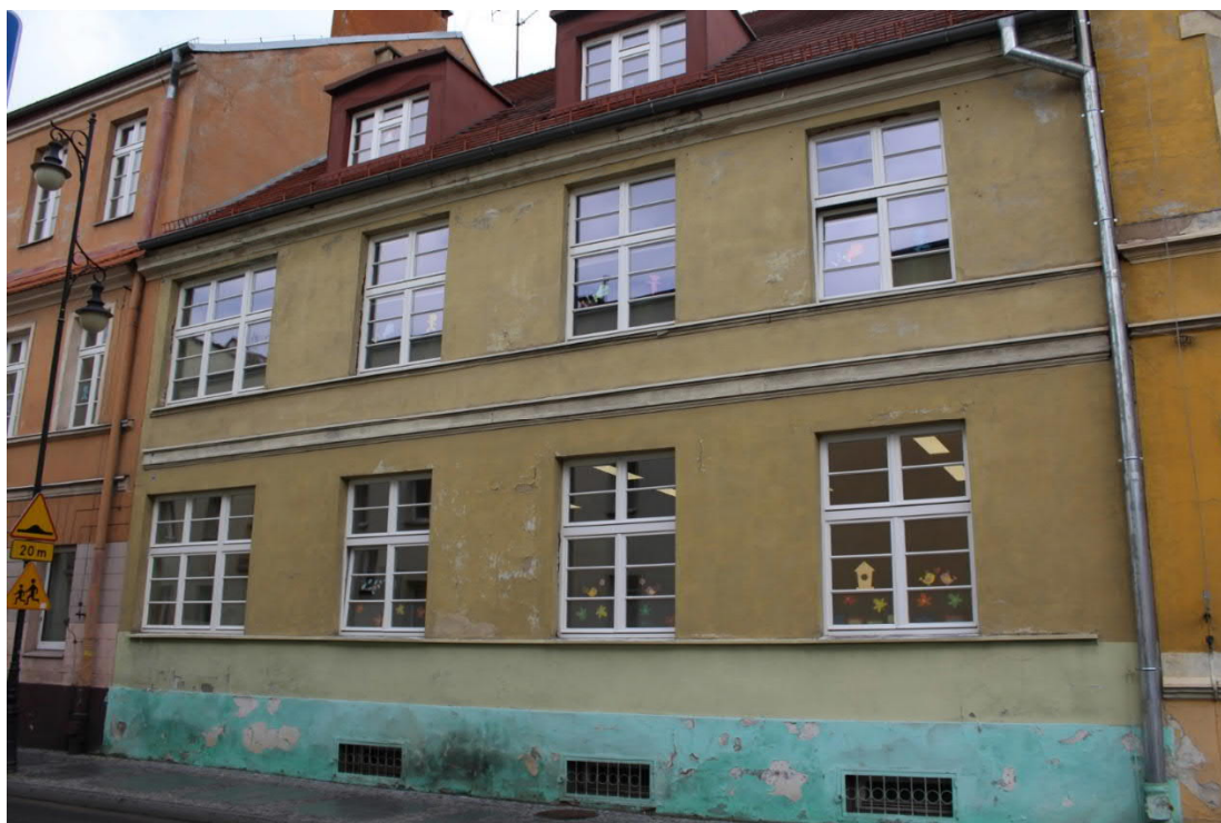
Elewacja zachodnia budynku nr 8.