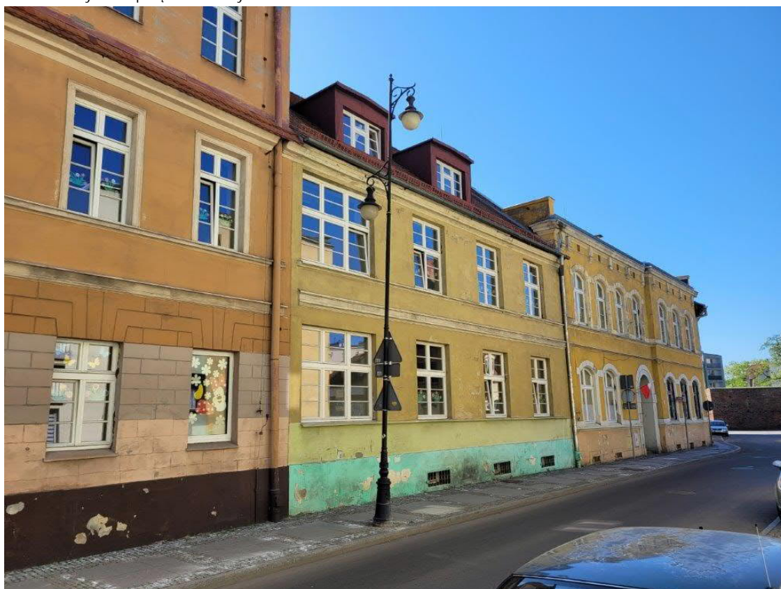
Widok na budynki w pierzei.