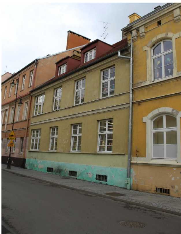
Uszkodzony tynk w strefie cokołowej oraz powyżej.