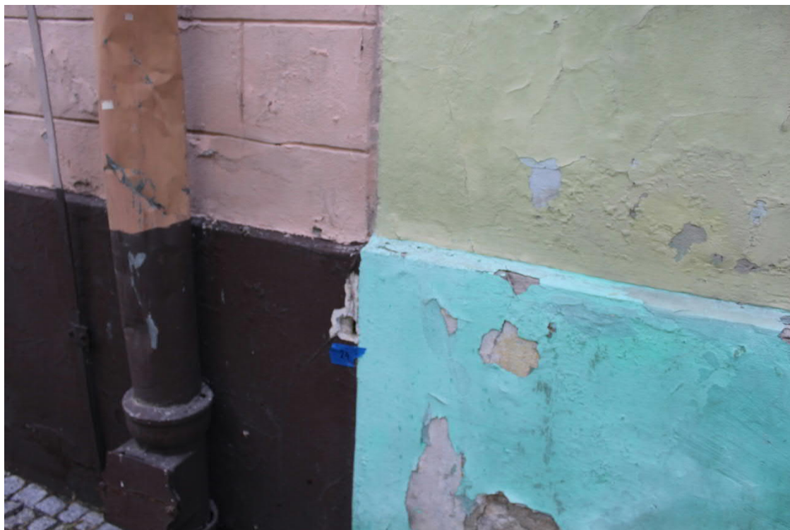
Zniszczone tynki na połączeniu budynków nr 8 i 9.